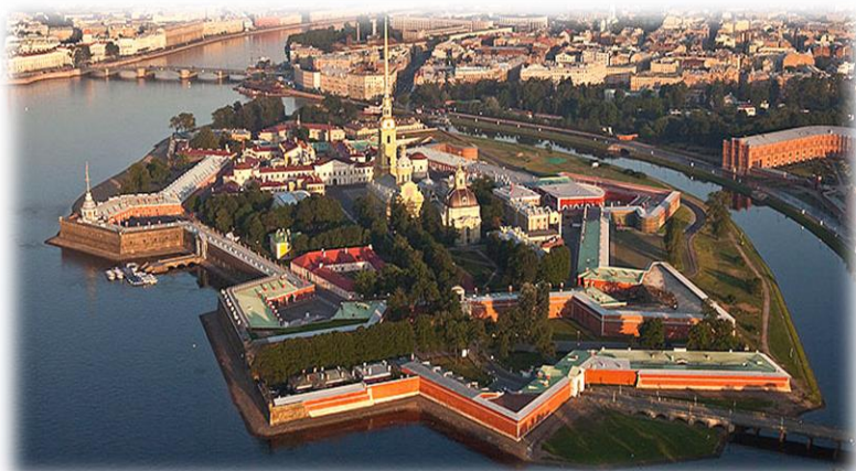
Fortezza SS Pietro e Paolo

Partenza con volo di linea per S. Pietroburgo. Snack a bordo. Arrivo, operazioni doganali e trasferimento in hotel. Sistemazione nelle camere riservate, cena e pernottamento.