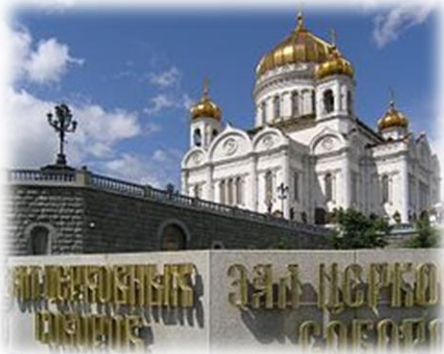
Cattedrale di Cristo Salvatore

Nel pomeriggio visita del Territorio del Cremlino , sorto sulla scoscesa riva sinistra della Moscova, è il nucleo più antico della città. Il perimetro delle sue mura è di circa 2 km, coronate da merli ghibellini e da 20 torri in mattoni rossi, la Piazza Rossa si estende lungo le mura orientali del Cremlino ed è la più antica di Mosca, risale infatti al secolo XV. Ingresso previsto in 2 cattedrali . Pernottamento.