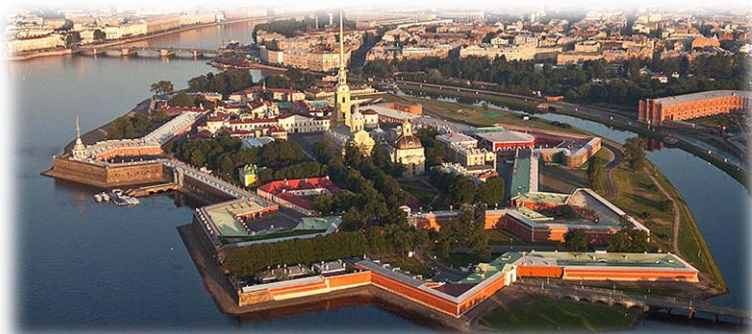
Fortezza SS Pietro e Paolo

Pensione completa. San Pietroburgo, la metropoli più nordica d'Europa, con i suoi 5 milioni di abitanti sorge sul delta del fiume Neva. La