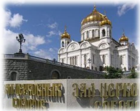
Cattedrale di Cristo Salvatore