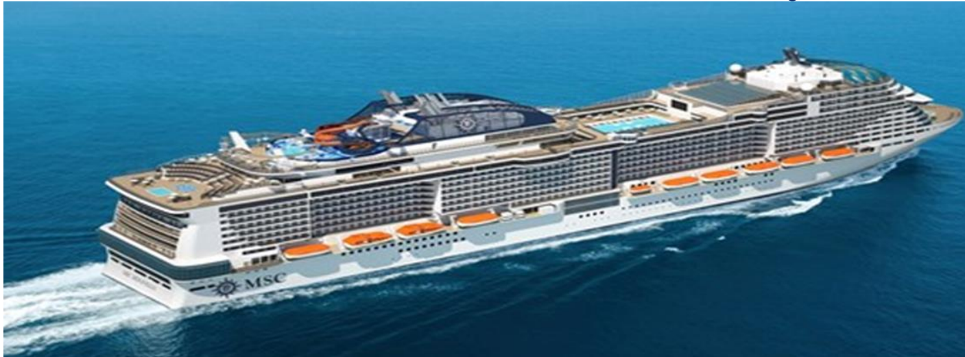
Tipo di cabina Interna